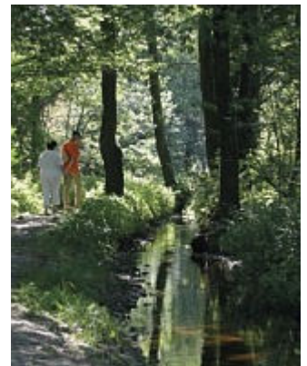
Ozubená kola v historii – technické památky Sokolovska