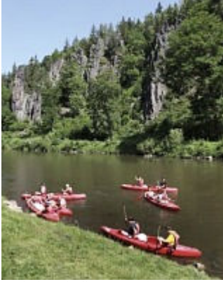
Vodácká pohádka – napříč krajem po řece Ohři