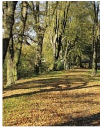
Poohřím do Chebu