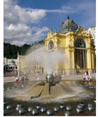
Středověk a lázeňská noblesa – Chebské a Mariánskolázeňsko