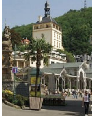
Karlovy Vary a okolí – lázeňská perla