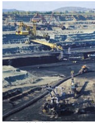
Okolo dolů a výsypek