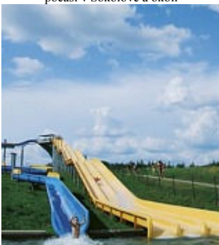
Osvěžení ve vodě – nejlepší rybníky a koupaliště