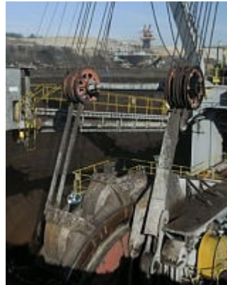
Nahlédněte do dolu – těžba uhlí od AdoZ