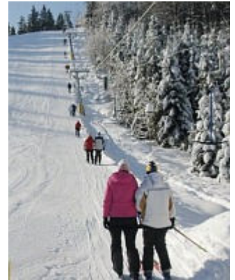
Zimní radovánky – radosti na sněhu