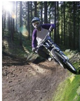
Adrenalinové zážitky – tep na maximum