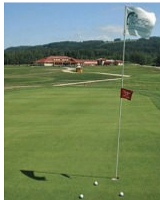
Golfový požitek – golfová klasika na západě