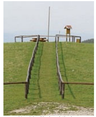
Vesničky Slavkovského lesa