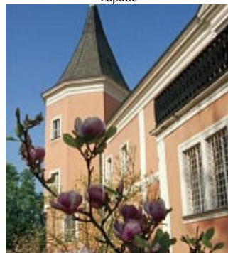
Stopovačka – úkol za úkolem Sokolovem