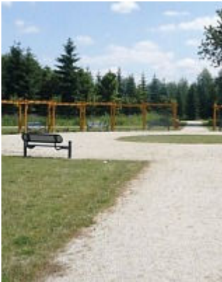
Okolo Sokolova – pěší výlety