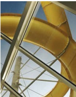
Když prší a fouká – program pro špatné počasí v Sokolově a okolí