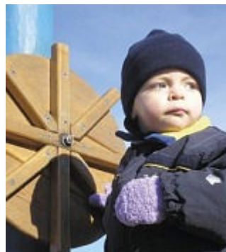
Děti vítány – program pro rodiny s dětmi