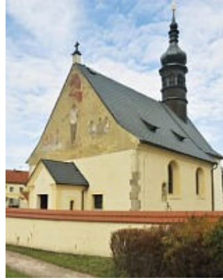
Krása svatostánků – církevní památky Sokolovska