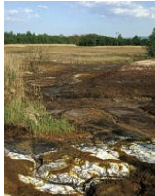
Podivuhodná krajina – přírodní divy