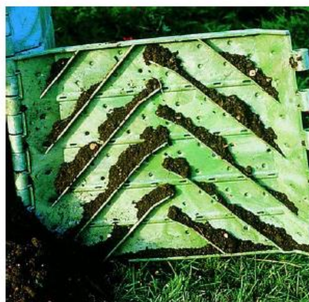
Obrázek: vizualizace kompostéru