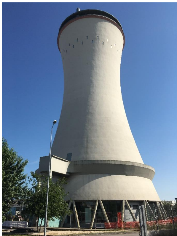
Obrázek 3 Benátská věž dědictví/Venezia Heritage Tower