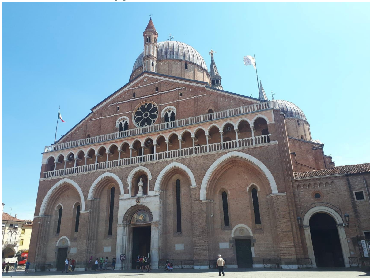
Obrázek 1 Město Padova a její skvost Bazilika svatého Antonína