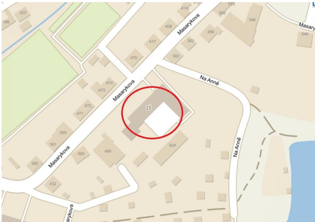
Obrázek 2: Mapa evakuačních míst